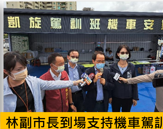
林副市長到場支持機車駕訓