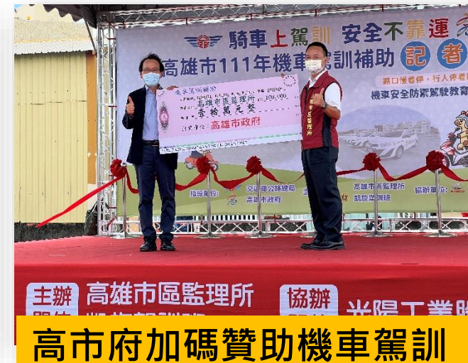
高市府加碼贊助機車駕訓