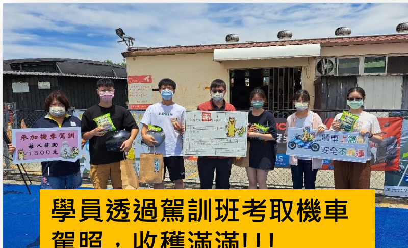
學員透過駕訓班考取機車駕照，收穫滿滿!!!